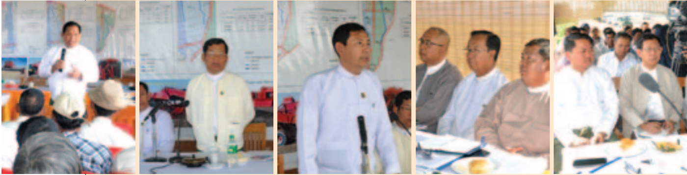
စီးပွားရေးနှင့်ကူးသန်းရောင်းဝယ်ရေးဝန်ကြီးဌာန မြည်ထောင်စုဝန်ကြီးဦးမြင့်လှိုင်မှ အမှာစကားပြောကြားခြင်း လယ်ယာစိုက်ပျိုးရေးနှင့် ဆည်မြောင်းဝန်ကြီးဌာန မြည်ထောင်စုဝန်ကြီး ဦးမြင့်လှိုင် မှ အမှာစကားပြောကြားခြင်း စွမ်းအင်ဝန်ကြီးဌာန မြည်ထောင်စုဝန်ကြီး ဦးသန်းဌေးမှ အမှာစကားပြောကြားခြင်း မြန်မာနိုင်ငံဆန်စပါးအသင်းချုပ် ဥက္ကဋ္ဌ ဦးချစ်ခိုင် နှင့် ဒါရိုက်တာအဖွဲ့ဝင်များတက်ရောက်

မြန်မာနိုင်ငံသည် ဆန်စပါးတင်ပို့သည် နိုင်ငံအဖြစ် ရပ်တည်ခဲ့ပြီး နိုင်ငံတော်စီးပွားရေးတိုးတက်အောင်လုပ်ဆောင်ရာတွင် ဆန်စပါးကဏ္ဍသည် အဓိက ကဏ္ဍကြီးတစ်ခုအဖြစ် ရည်ရွယ်ထားရှိပါသည်။ နိုင်ငံတော်၏ အရန်ဆန်သည် ပြည်တွင်းစားနပ်ရိက္ခာလုံလုံမှုကို ထိန်းသိမ်းထားနိုင်ရန်နှင့် ပြည်တွင်းဆန်စပါးဈေးတည်ငြိမ်မှုအတွက် ကောင်းစွာ ထိရောက်နိုင်ပြီး ဆန်စပါးတင်ပို့မှု တိုးမြှင့်နိုင်ရန် ကောင်းစွာ အထောက်အကူပြုပါသည်။ ထို့ကြောင့် နိုင်ငံတော်အရန်ဆန် ဝယ်ယူရေးညှိနှိုင်း အစည်းအဝေးကို ၂၀၁၃ ခုနှစ်၊ ဇန်နဝါရီလ ၇ ရက်နေ့တွင် နေပြည်တော်၌ ကျင်းပပြုလုပ်ခဲ့ပါသည်။ အဆိုပါအစည်းအဝေးတွင် လယ်ယာစိုက်ပျိုးရေးနှင့် ဆည်မြောင်းဝန်ကြီးဌာန မြည်ထောင်စုဝန်ကြီးဦးမြင့်လှိုင်၊ စွမ်းအင်ဝန်ကြီးဌာန မြည်ထောင်စုဝန်ကြီးဦးသန်းဌေး၊ စီးပွားရေးနှင့်ကူးသန်းရောင်းဝယ်ရေးဝန်ကြီးဌာန မြည်ထောင်စုဝန်ကြီးဦးမြင့် တို့မှ တက်ရောက်ခဲ့ကြပါသည်။