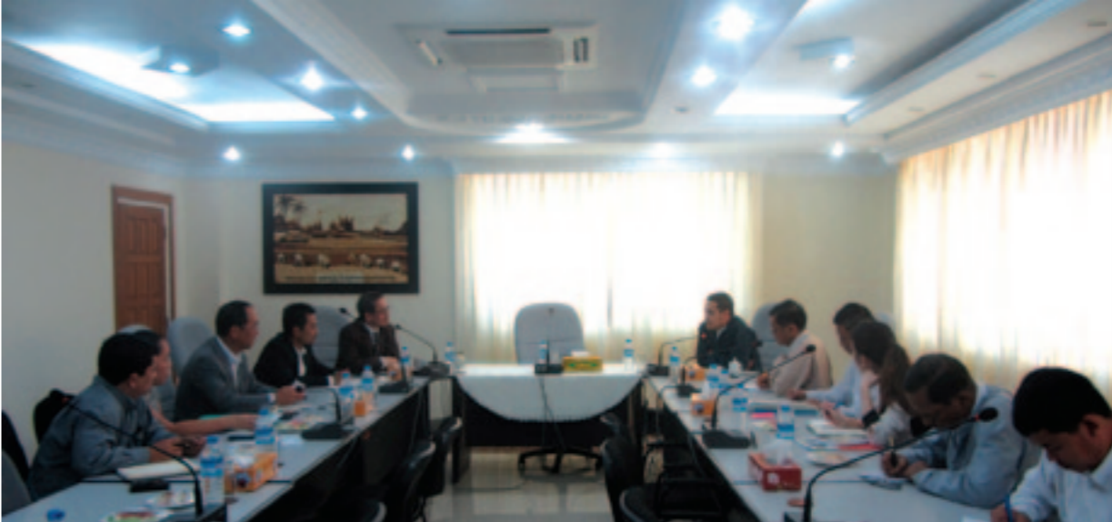
မြန်မာနိုင်ငံလယ်ယာစီးပွားရေးအများပိုင်ကော်ပိုရေးရှင်း (MAPCO) နှင့် MITSUI Co., Ltd (Japan) တို့ ပုံမှန်တွေ့ဆုံဆွေးနွေးခြင်း

“ MITSUI မှ လည်း မြန်မာနိုင်ငံ ကျေးလက်ဒေသ ဖွံ့ဖြိုးရေးအတွက် ရင်းနှီးမြှုပ်နှံမှုများတွင် ပါဝင် ထောက်ပံ့ပေးမည်ဖြစ်ကြောင်း ပြန်လည် ပြောကြားခဲ့ပါသည်။ ”